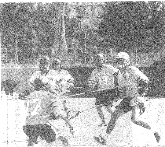
対関学戦、ボールを奪いあつた両チームの選手達。(11月3日・神戸ユニバーシティ球技場)

関西学生ラクロスリーグ 一月三日の第七戦で関学に戦った神戸大は、十三-五で快勝。二位以内でプレーオフ出場が確定し、三年ぶりの全日本選手権出場に大きく近づいた。