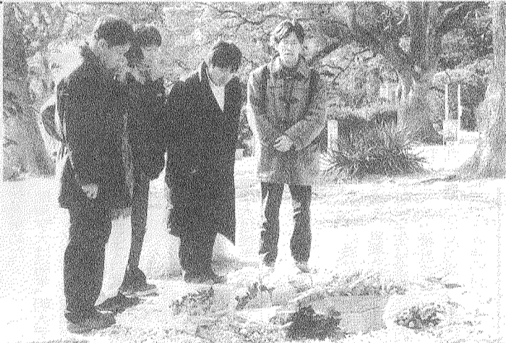
「1月17日、六甲台キャンパスの兵庫県南部地震神戸大犠牲者慰霊碑で撮影(板谷亜紀子)」

「一月末現在の神戸大の医学部を除く九学部の就職内定率は八七七・七〇(男子九〇・五〇、女子八一・一〇)であるが、学生部厚生課の調べで、学生部が希望者から内定届けを受け取り、その数を就職希望者数で割って内定率を算出する。」