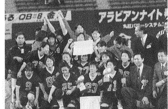
タッチフット部はさくらボウル、東西王座、シュガーボウルの三冠を達成(1月3日・東京ドームで)

近畿地区国立大学体育大会で総合女子三位、男子が四位。また、一橋大、大市大との三商戦では十八回連続三十一回目の総合優勝を果たすなど、総合でみると確かな実力を持つ神戸大。関西リーグや全国大会での個々の部の活躍も見逃せない。 タッチフット部がシュガーボウル、東西大学王座決定戦、さらにはさくらボウルで優勝し、見事三冠を達成した。男子ラクロス部は関西リーグを全勝、二年連続で全日本選手権に出場した。 一方で、一部リーグの厳しさを思い知らされた年でもあった。アメフト部は五位でリーグを終え、抽選の結果、辛くも一部残留となった。十数年ぶりに一部復帰した男子バスケットボール部は強豪の前に倒れ、アイスホッケー部は入れ替え戦に敗れて、それぞれ部へ降格した。