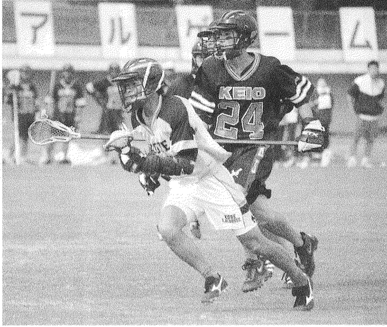
果敢に攻めるも、慶大DF陣を切り崩せない(5月4日・王子公園陸上競技場で)

昨年度の東西学生王者が激突する男子ラクロストライアルゲームが五月四日、王子公園陸上競技場で、GW中といふこともあり、競技場には多くの観客や神戸大応援団が訪れた。第1Q開始直後、慶大のMF花房が神戸大のディフェンス網をかいくぐり先制点を奪取すると、試合の流れは一気に慶大に傾く。A大吉直樹をはじめとする慶大オフェンス陣の猛攻と、神戸大のミスブレイもあって第1Qで慶大は5点、第2Qで4点、第3Qで3点、第4Qで2点を奪取し、最終スコアは14対0の大敗に終わった。