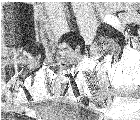
白衣で熱演するメンバー。会場からは笑い声も・・・(4月21日・大阪城野外音楽堂で)

第十一回くもん大阪城ジャズフェスティバルが四月二十一日、大阪城野外音楽堂で行われた。KOBEMUSIC JAZZは毎年ユニークな衣装で会場をわくわく神戸大。今年度は農学部から借りたという楽部JAZZは小雨が降る中熱い演奏を披露。会場全体が「ジャズ」を染しんだ。 初日は天理大・京大・神戸大・阪大の四大学が出演。曲「MOON TRAIL」「QUINTUDE」。