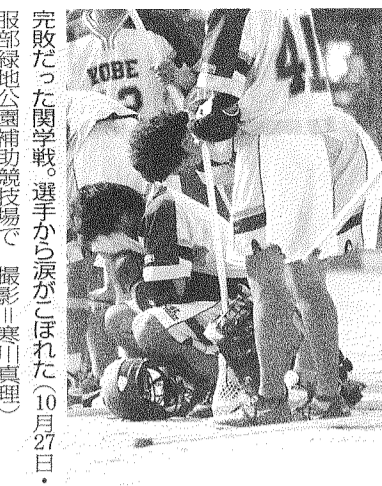
完敗だった関学戦。選手から涙がこぼれた(10月27日・服部緑地公園補助競技場で)

リーグ4連覇を目指した神戸大だったが、昨年の主力が抜けた穴は大きく、同大に3-9で完敗、立命館は引き分けと苦しい試合が続いた。