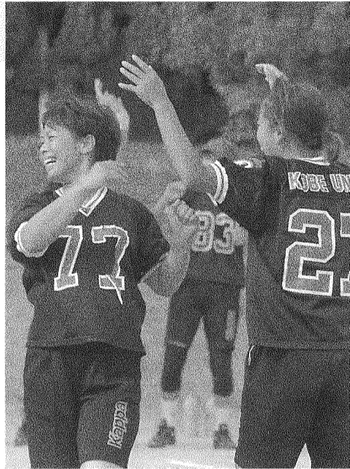
決勝TDDが決まり、歓喜のハイタッチ (10月28日・聖和大会)