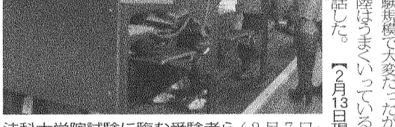
法科大学院試験に臨む受験者ら(2月7日、六甲台第一学舎で)

伏流水 ▽試合で2本のホームランを放ち「普通通です」と話した。阪南大に勝利し「野球人生で初めて泣いた」という1年前の主将、引退して入替戦を回避し「一生分の運を使い果たしました」と笑った2年前の主将。三強の一角・関学に2点差で敗れ「接戦はいい。勝ちたい」と意を固めた1年前の主将。前者はアメフト部の主将の言葉だ。よくしゃべる人、寡黙な人、感情を表に出す人。それぞれの言葉には、それぞれの個性が、よくあらわれている。▽そんな個性豊かな主将たちに共鳴する思い、それは目標を達成するまで絶対にあきらめないこと。国立大である神戸大は私大に比べ、人材確保、設備などの面でどうしても不利だ。しかし、野球部の「神宮」アメフト部の「甲子園」、それぞれの「聖地」へ主将たちを中心としたチームは挑戦し続けた。何かが乗り越えなければならぬものができたとき、主将たちの言葉、姿勢が頭をよぎる。4年生の春を迎えようとしている今、春季リーグ戦ならぬ春季就職活動が開幕する。目標を達成するまであきらめない。そんな主将たちの思いを胸に戦い抜こうと思う。 【中島仁志】