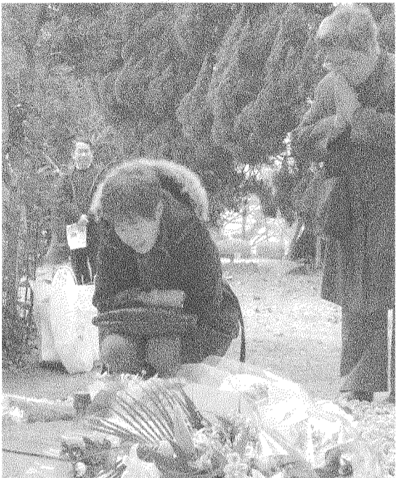
静まり返った慰霊碑に祈りを捧げる遺族(1月17日、六甲台学舎震災慰霊碑で)

9年過ぎて「昨日のこと」 今年も震災慰霊碑に花 学生、教職員あわせて44人の神戸大関係者が亡くなった阪神・淡路大震災から、9年が経った。今年、六甲台第一学舎前にある震災慰霊碑には遺族らによる献花式は、1月17日