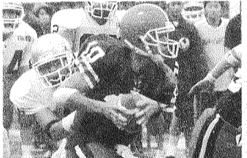
アメフト春季 後半にミス連発 関大戦で課題鮮明に

春季王者を決める男子アウェイシリーズの神戸大は前年AT熊野の得点などでペースをつかみ4-2とリードするが、第3Qに逆転される。その後はバ