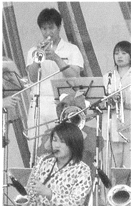
パジャマ姿で熱演する軽音楽部のメンバー(提供写真)

パジャマ姿でスイング 第14回くもん神戸大生も熱演 大阪城野外音楽堂で4月24日、関西9大学と高校1校による第14回くもんJAZZフェスティバルが行われ、神戸大からは軽音楽部ジャズ「コウベ・マシ」が出演。観客席はほぼ満員だった。 パジャマ姿でスイングする軽音楽部のメンバー(提供写真)