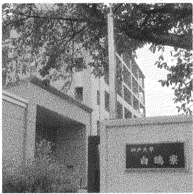
海事科学部生以外の学生も入寮し、白鷗寮も変化している(9月22日・神戸大白鷗寮で)

キャンパス越えて交流を 統合から1年 海事科学部の模索続く 神戸大と神戸商船大の統合から10月でちょうど1年となる。これまで海洋、海事に特化していた神戸商船大は、神戸大海事科学部となり、より幅広い教育を目指している。 「商船だけの教育で足りなかった部分を他学部との交流で補っていくための土壌を築きつつある」と西田海軍科学部長は話す。「行政マンを育てたい」「(同僚)という同僚部として、社会学、理工学との融合は理想的だ。しかし、キャンパスの離れた海事科学部では履休みなどに他学部との交流がない。「海事にどんどん遊びに来てほしい」と1年生は他の学部の学生と接するのでも、様々な価値観が響き合ってくる。上下関係の厳しい白鷗寮が、新たな価値観によって変化していることを感じるようだ。 課外活動では、キャンパスが離れているため海事科学部生が不便に感じることが多い。通うのが大変との