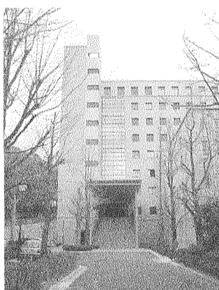
完成したフロンティア館

5 フロンティア館竣工 社会科学系の拠点に 社会科学系5部局共有の図書館と研究施設からなる、総工費約25億円をかけた総合研究棟「社会科学系フロンティア館」が昨年10月に竣工した。外観はキャンパス内で最も古い六甲台キャンパスに合わせた落ち着いた雰囲気で、地下2階から地上2階までの社会科学系図書館には、国内外の学術雑誌約3000点が閲覧できる。雑誌閲覧室や貴重書庫、震災文庫などがある。地上4階から8階は社会科学系5分野の総合研究棟で、若い研究者も多く入り、大学の個性が求められる中で若手の独創的な研究が期待される。(武井礼美)