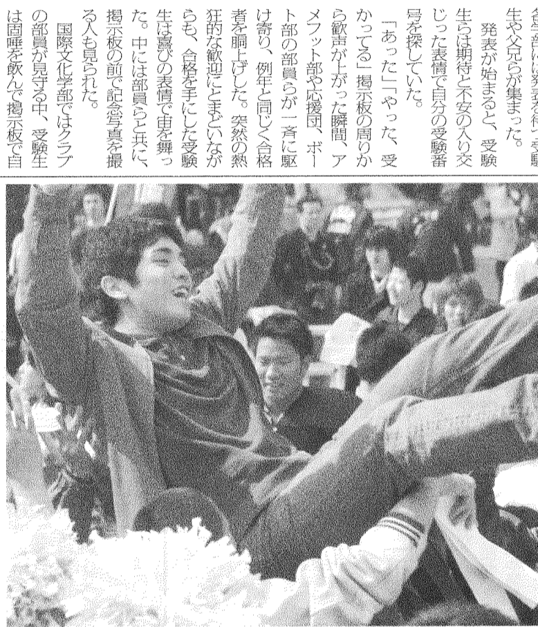
大勢の人が集まる中、胴上げされる合格者。運動部員らと喜びを分かち合った。(3月10日・六甲台第1学舎前で撮影=河合優)

神戸大入学試験(平成17年度)の合格発表が前期3月10日、後期3月23日に各学部で行なわれた。今年は11学部合わせて727人が合格した。結果が発表される午前10時前、各学部には発表を待つ受験生や父兄らが集まった。発表が始まると、受験生らは期待と不安の入り交じった表情で自分の受験番号を探していた。 「あった」「やった、受かった」と合格者の周りから歓声が上がった瞬間、アフット部や応援団、ポーター部の部員らが一斉に駆け寄り、例年と同じく合格者を胴上げした。突然の熱狂的な歓迎に「まじいながら合格を手にした受験生は喜びの表情で手を舞った。中には部員らと共に、掲示板の前で記念写真を撮る人も見られた。 国際文化学部ではクラブの部員が見守る中、受験生は固唾を飲んで、掲示板で自分の番号を確認した。前期3月10日、後期3月23日に各学部で行なわれた。今年は11学部合わせて727人が合格した。結果が発表される午前10時前、各学部には発表を待つ受験生や父兄らが集まった。発表が始まると、受験生らは期待と不安の入り交じった表情で自分の受験番号を探していた。 「あった」「やった、受かった」と合格者の周りから歓声が上がった瞬間、アフット部や応援団、ポーター部の部員らが一斉に駆け寄り、例年と同じく合格者を胴上げした。突然の熱狂的な歓迎に「まじいながら合格を手にした受験生は喜びの表情で手を舞った。中には部員らと共に、掲示板の前で記念写真を撮る人も見られた。