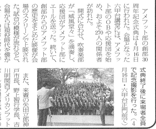
式典終了後に来場者全員で記念撮影を行った。(4月16日・六甲台正門前で)

レイバンズの愛称で親しまれるアマフット部が今年で創部30周年を迎えた。六甲台講堂では同部のOB、OGを招いて記念式典が催された。