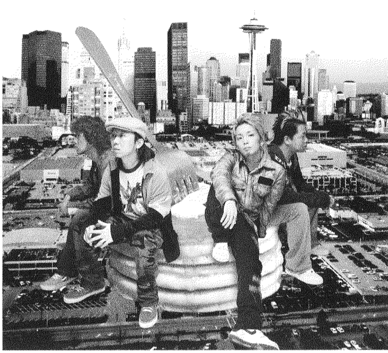
プロコンゲストの175R。2日目にライブを行う。

プロコンは午後4時開場 各団体も特色ある企画を準備 神戸大で最大のイベント「六甲祭」今年も「Re:」(Response)をテーマに11月12・13日に開催される。神戸大生みんなの期待・協力の「Re:」として「神大生一人一人に開かれた六甲祭」を目指すという。