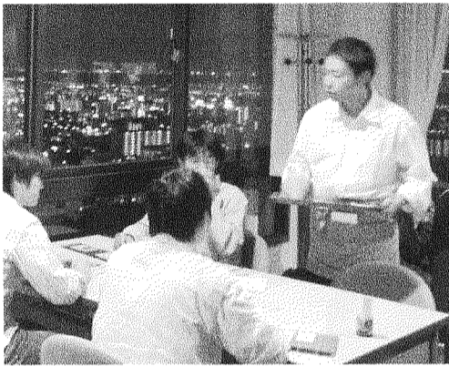
神戸市街を一望できる店内(10月21日・文理農キャンパスLANSSBOXで撮影＝笹川和彦)

神戸大生協組織部「みちくさプロジェクト」による秋恒例の2日間限定カクテルパーティー「MS BAR」が今年も10月20日と21日の両日、文理農キャンパスLANSSBOXの2階喫茶スペースで開催した。店内では待ち客が出るほどの盛況となり、成功をおさめた。 このカクテルパーティーは毎年10月にプロジェクトに参加している約30人の学生によって開かれているもので、今年で4年目を迎えた。スタッフはほぼ全学部から集まっている。 毎年、メンバーのアイデアによってテーマやコンセプトが掲げられており、今年(今年も)恒例の