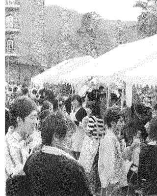
多くの人でにぎわう模擬店(10月16日・名谷キャンパスにて)

お笑いライブで大盛況 名谷祭 学外者もフリマ出店 神戸大医学部保健学科(須磨区)の「名谷祭」が10月15日と16日、名谷キャンパスで開催された。会場では専攻別の模擬店や、フリーマーケットが出店。初日はあいにくの雨だったが、2日目は南海キャンディーズなどによるライブが開かれ、大きな盛り上がりを見せた。 今年のテーマは「Back to Me」。「騒ぎな(な)を(を)起こす」という意味から、誰もが楽しめるようなお祭り騒ぎを引き起こそうという思いが込められた。「来印船ゲーム」では、別々のキーワードの書かれた札をもらい、会場の中から同じ札を付けているパートナーを探す。見事見つければ、割引券やペアゲーム参加などの特典が。