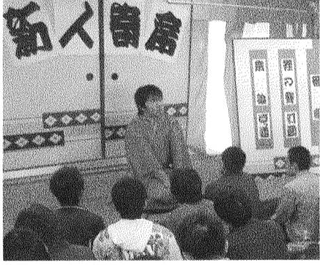
軽妙な語りで会場を沸かせる新人囃家(10月13日・国際文化学部B棟休養室で撮影＝笹川和彦)

学生の運転技術に問題がある可能性は否定できないが、一方で「駅の辺りは何ともないのに、大学に近づくと(道路が)急に滑りやすくなった(発達・まこと)の声もある。 慎重な運転は必要だが、ブレーキの多用はかえって事故につながる恐れがある。普段より速度を落とす、あるいはバスや徒歩で通学するといった対策で事故は防げる。 バイクや原付の運転経験が少ない1回生は、特に注意が必要だ。