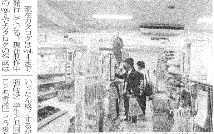
生協購買部でオリジナルグッズを見る学生ら。(10月23日・国文店内で撮影＝西田健悟)

は全部で3種類ある。オリジナルティあふれる商品が並ぶが、中でも老舗の亀井堂本店謹製の瓦せんべいは、帰省のお土産として人気がある。ボールペンやTシャツ、ボールペンは、神戸大の応援団旗の色に合わせてオレンジ色のTシャツが作られた。Tシャツは現在3種類のデザインがあり、長袖のトレーナーも販売されている。 オレンジ色の応援観戦グッズには、Tシャツのほかにスポーツマフラーやタオルなどもある。グッズ販売に定評のある京大生協に助言を求め、商品の充実化を図った。 最も新しい商品は、今年3月末に登場した図書カードだ。神戸大の風景の写真がプリントされ、デザイン