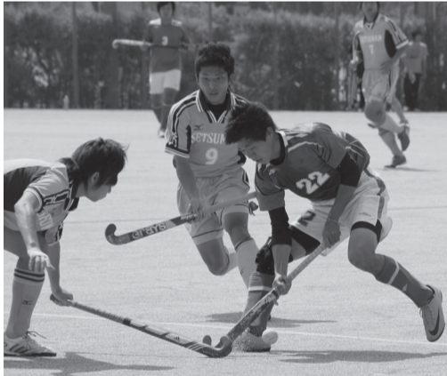
なかなか突破口を開くことができなかった(右・神戸大) (6月12日・甲南大甲アイランドグラウンドで)