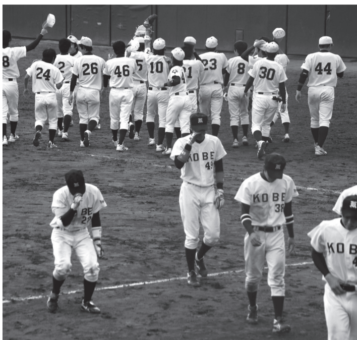
降格が決まり、うつむく神戸大の選手ら(手前) (5月27日・豊中ローズ球場で)

近畿学生野球春季リーグ一部・2部入替戦2回戦、神戸大1部大が5月27日、豊中ローズ球場で行われたリーグ戦で最下位に沈んだ神戸大。前日に行われた1回戦で0-3と完封負けを喫した後がなかったが、1-1の7回にスクイズで決勝点を奪われ2-1で借敗。連敗で37季ぶりの2部への降格が決まった。 ベンチに戻る途中で、多くの選手が泣き崩れた。「悔しいというだけ」。石浜主将(発達・4年)が絞り出すような声で話す。18年以上、1部の常連として