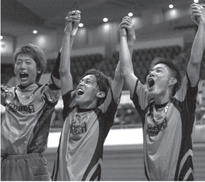
3連覇を果たし、歓喜に沸く選手ら(8月29日・舞洲アリーナで)

神戸大が、大学フットサル界に新たな歴史を刻んだ。8月27日から29日にかけて舞洲アリーナで行われた全日本大学フットサル大会。グループリーグを3戦全勝で通過した神戸大は、準決勝で高知大サッカー部に3-2で勝利。順天堂との決勝は、延長までもつれ込んだ激闘を3-2で制し、神戸大フットサル大会。グループリーグを3戦全勝で通過した神戸大は、準決勝で高知大サッカー部に3-2で勝利。順天堂との決勝は、延長までもつれ込んだ激闘を3-2で制し、神戸大フットサル大会。グループリーグを3戦全勝で通過した神戸大は、準決勝で高知大サッカー部に3-2で勝利。順天堂との決勝は、延長までもつれ込んだ激闘を3-2で制し、神戸大フットサル大会。